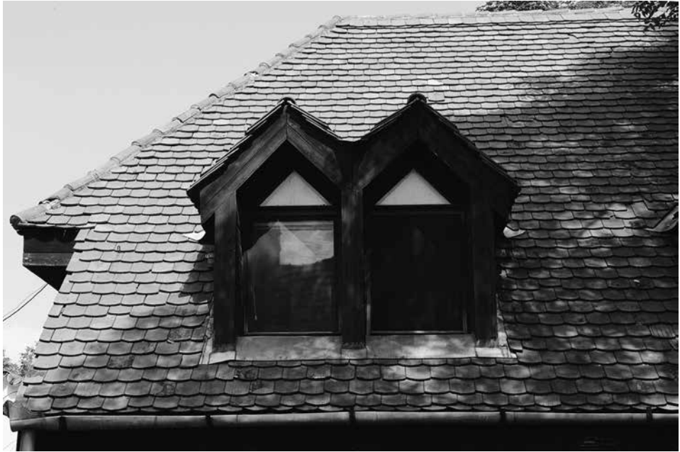
Nemzetközi Kerámia Stúdió