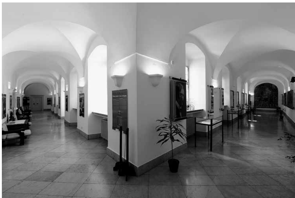
Kodály Intézet, belső