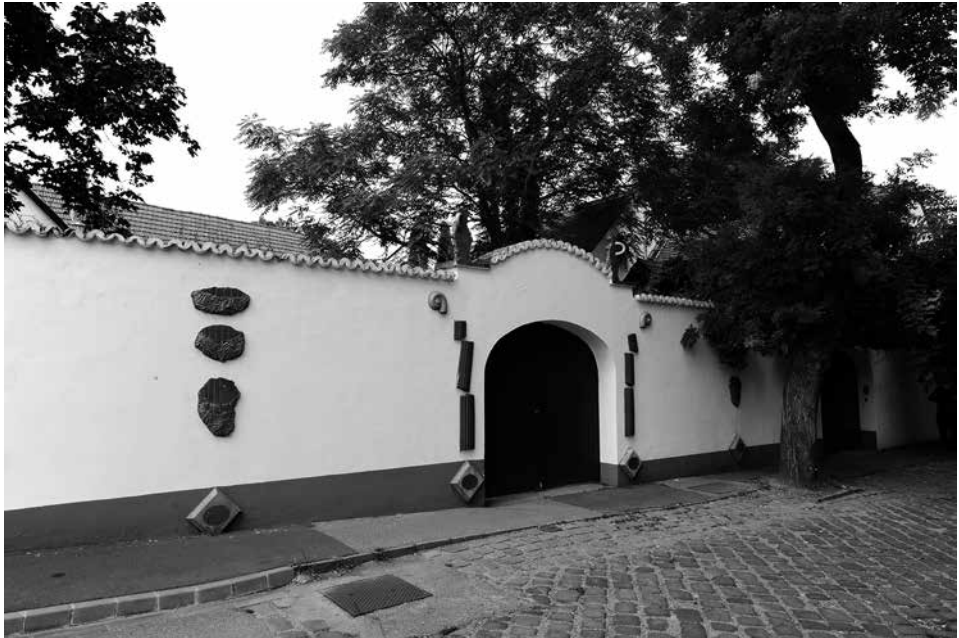
Nemzetközi Kerámia Stúdió