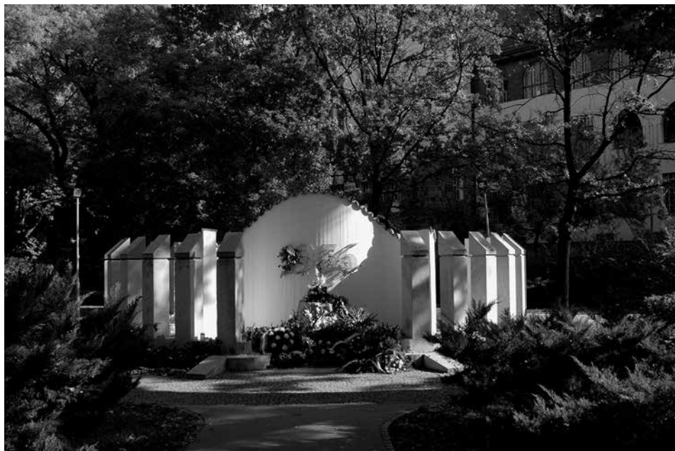
56-os emlékmű, Kecskemét