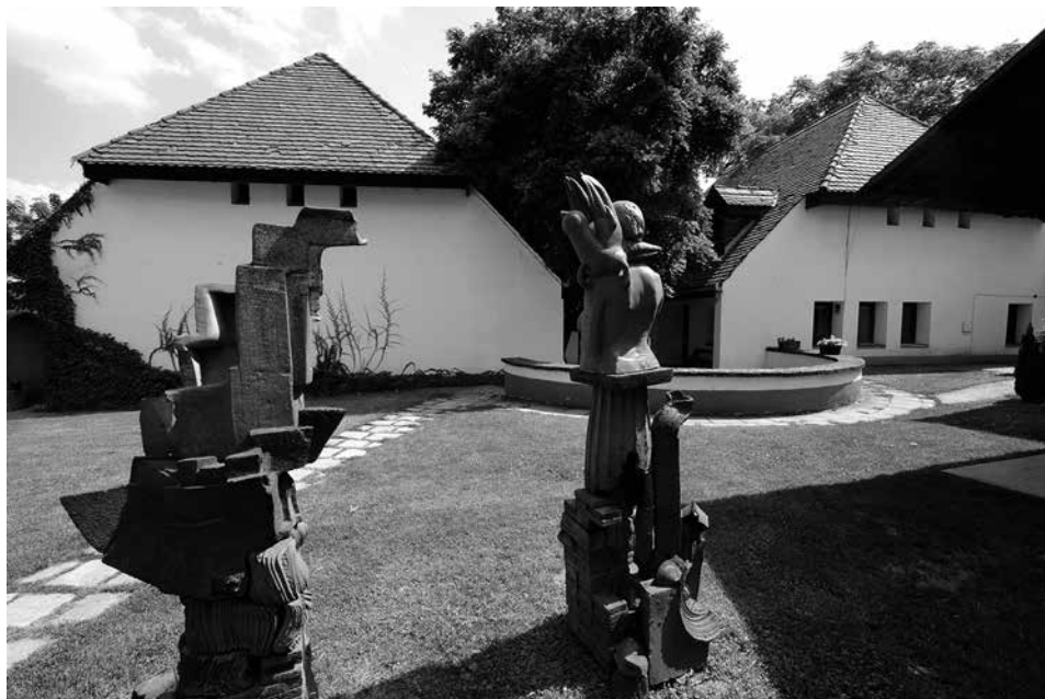
Nemzetközi Kerámia Stúdió