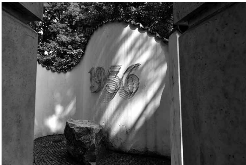
56-os emlékmű, Kecskemét