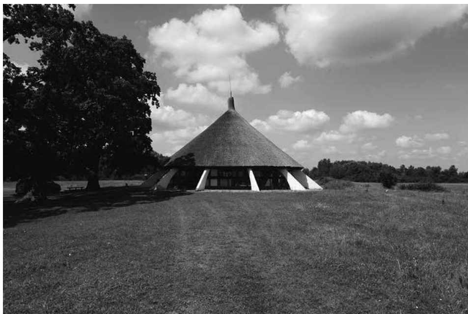
Bugac, Pásztor Múzeum