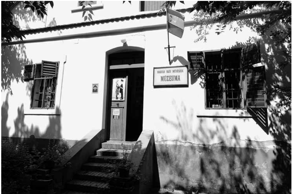
Női Művészek Múzeuma