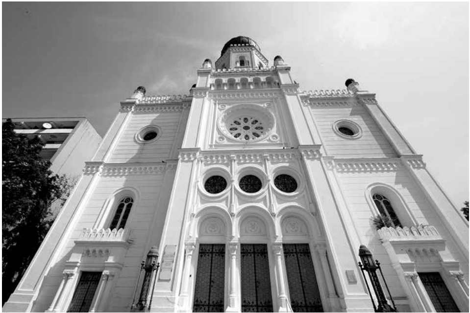
Tudomány és Technika Háza