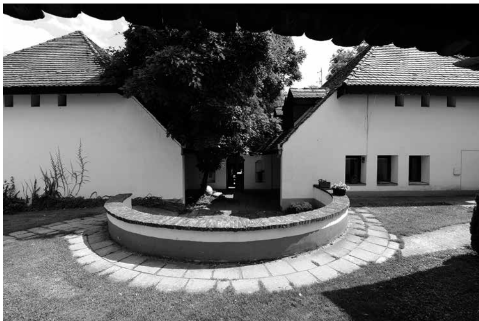
Nemzetközi Kerámia Stúdió