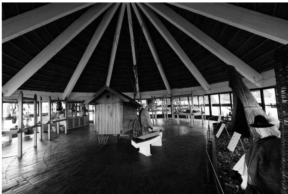
Bugac, Pásztor Múzeum