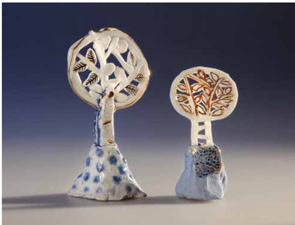
Talizmán a Kicsinek, talizmán a Nagynak – mázas porcelán, samott; 1300 °C redukció; máz alatti festés, arany lüszter; magasság: 7 cm, 6 cm