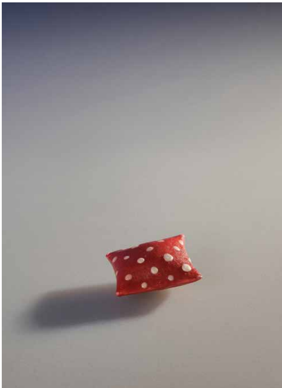
Tied talizmán – mázas porcelán; 1300 °C redukció; máz alatti festés; 2×3 cm