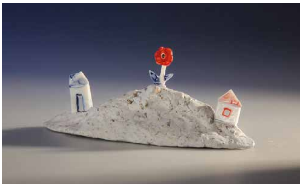
Ha esteleg mégis... talizmán; mázas porcelán, samott; 1300 °C redukció; máz alatti festés, arany lüszter; magasság: 6 cm