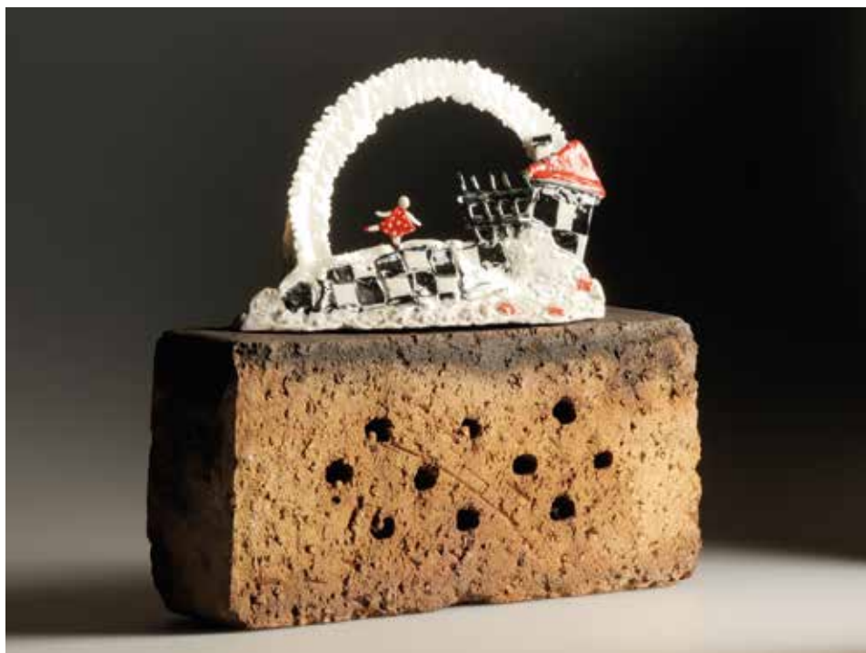
Borotvaélen táncoló – Bladerunner; mázas porcelán, samott; 1300 °C redukció; máz alatti festés, téglá; magasság: 25 cm