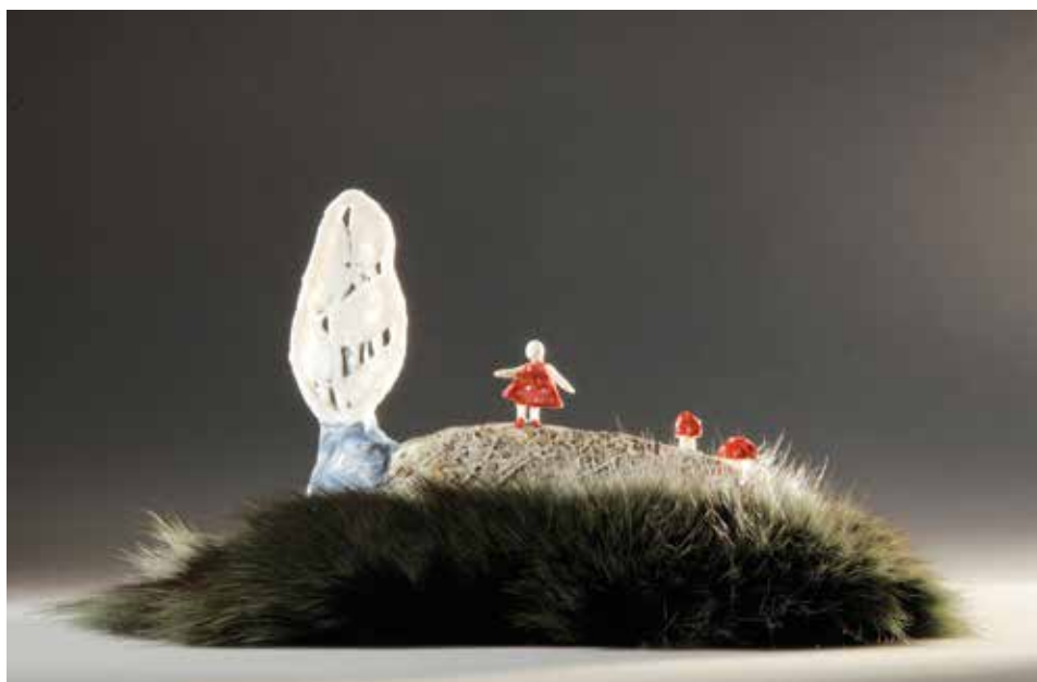
Bolondgomba – mázas porcelán, samott; 1300 °C redukció; máz alatti festés, festett ezüstrókaszór; magasság: 6 cm