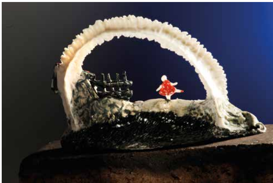
Borotvaélen táncoló – Bladerunner (háttoldal)