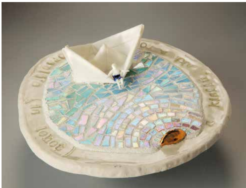
Az első naplemente – mázas porcelán; 1300 °C redukció; máz alatti festés, arany lüszter; SICIS üvegmozaik; átmérő: 24 cm