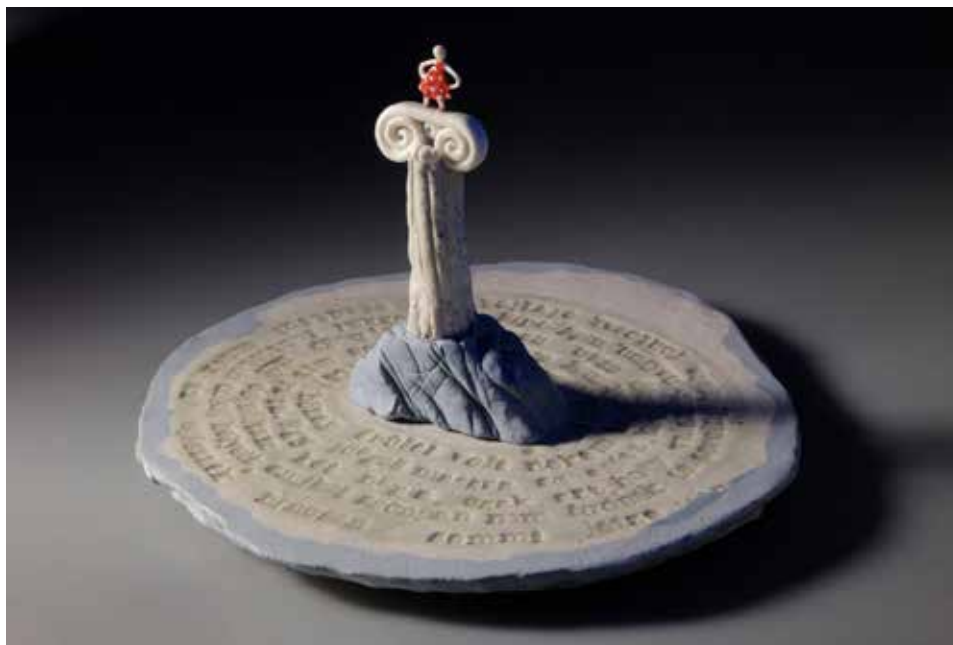
Oszlpos történet – mázas porcelán, samott; 1300 °C redukció; máz alatti festés; átmérő: 30 cm