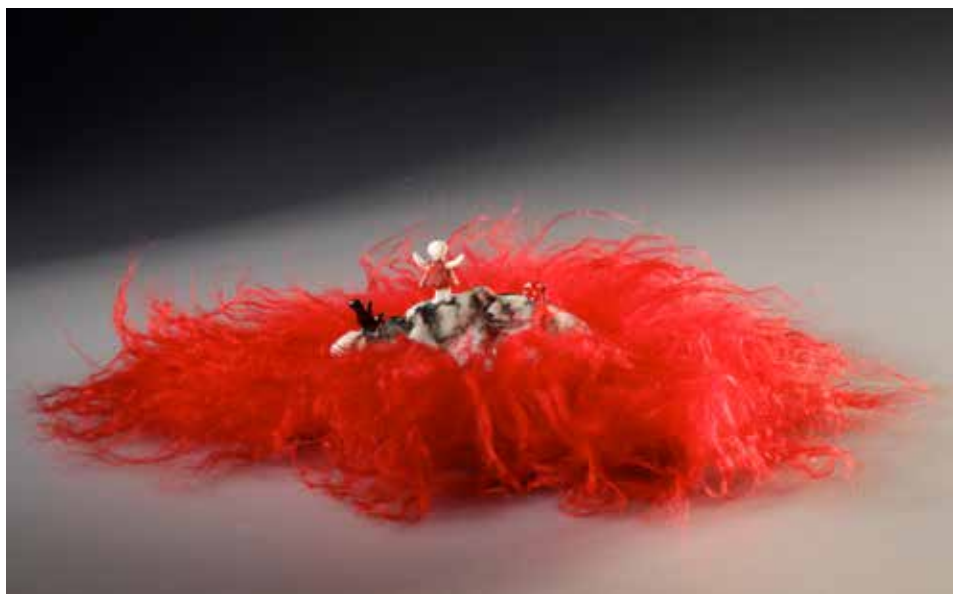
Pötytyős labda – mázas porcelán, samott; 1300 °C redukció; máz alatti festés, festett mongol jakszór; magasság: 5 cm