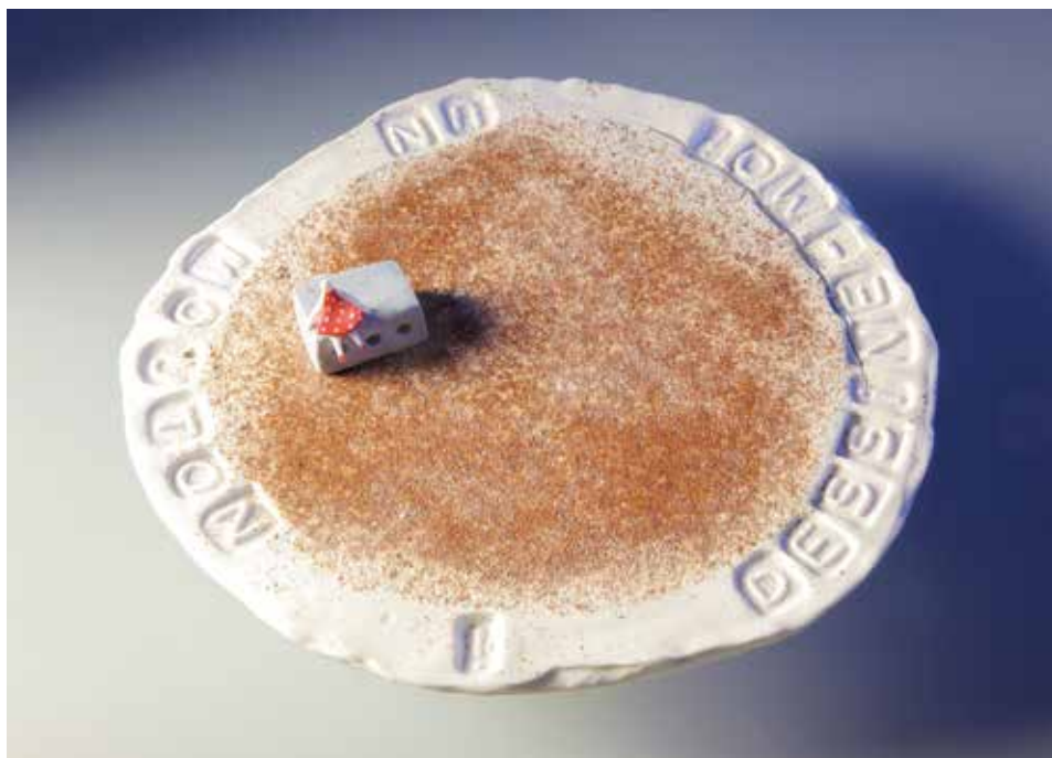
Sivtag – porcelán, samott, homok; 1300 °C redukció; átmérő: 22 cm