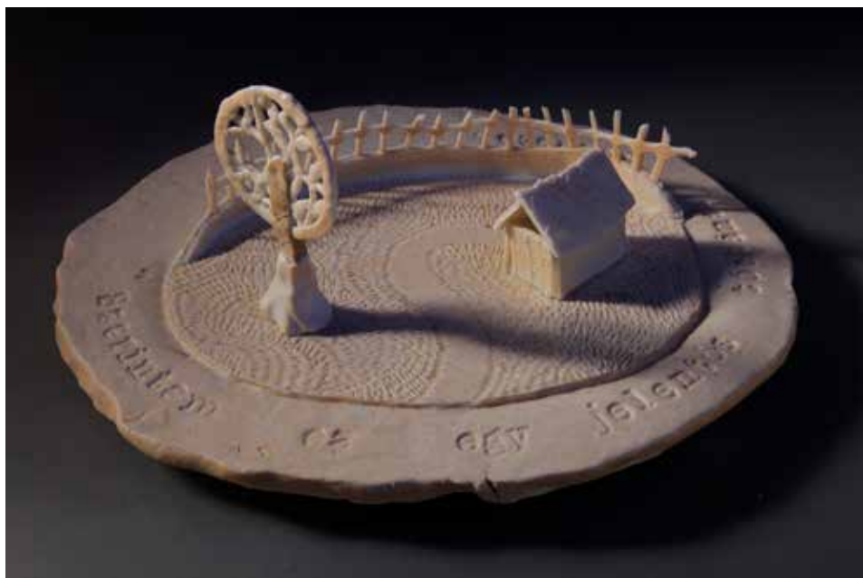
Casa Blanca 2.0 – Kisház diófával; porcelán; 1280 °C futűzes redukció; átmérő: 28 cm