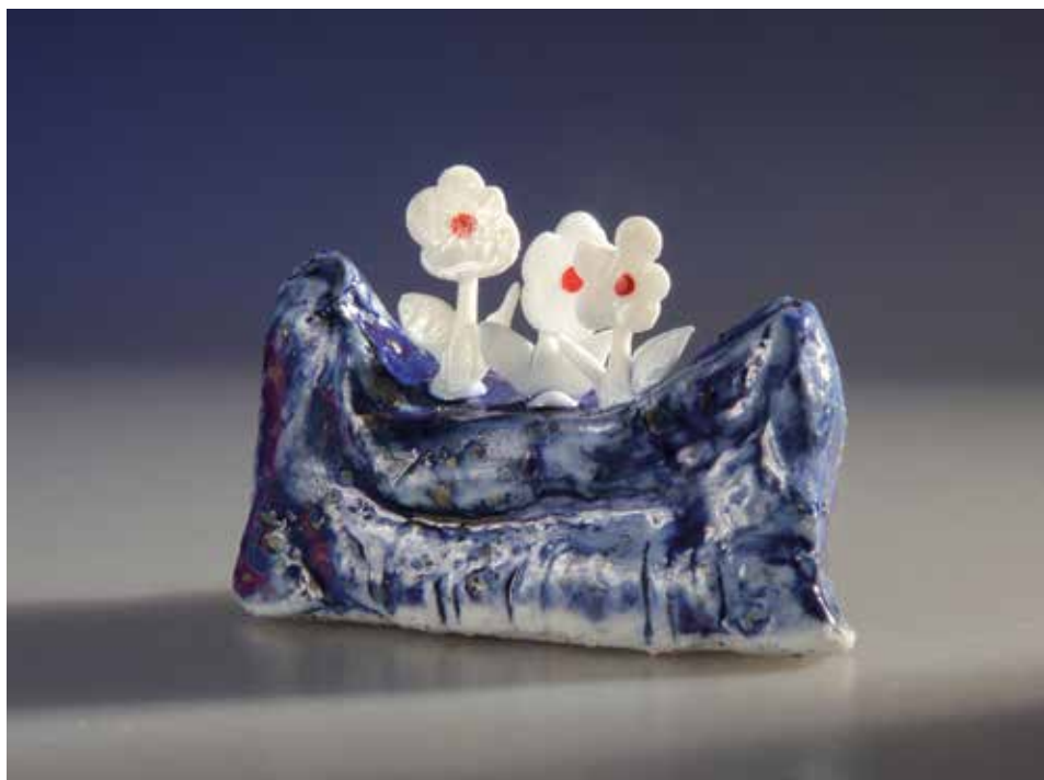
Talizmán, hogy legyen kanapé – mázas porcelán, samott; 1300 °C redukció; máz alatti festés; magasság: 4 cm