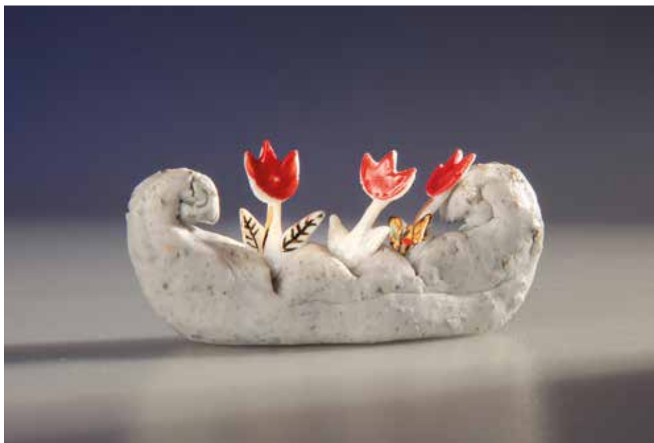
Talizmán az Olümposz irányába tartóknak – mázas porcelán, samott; 1300 °C redukció; máz alatti festés, arany lüszter; magasság: 3 cm