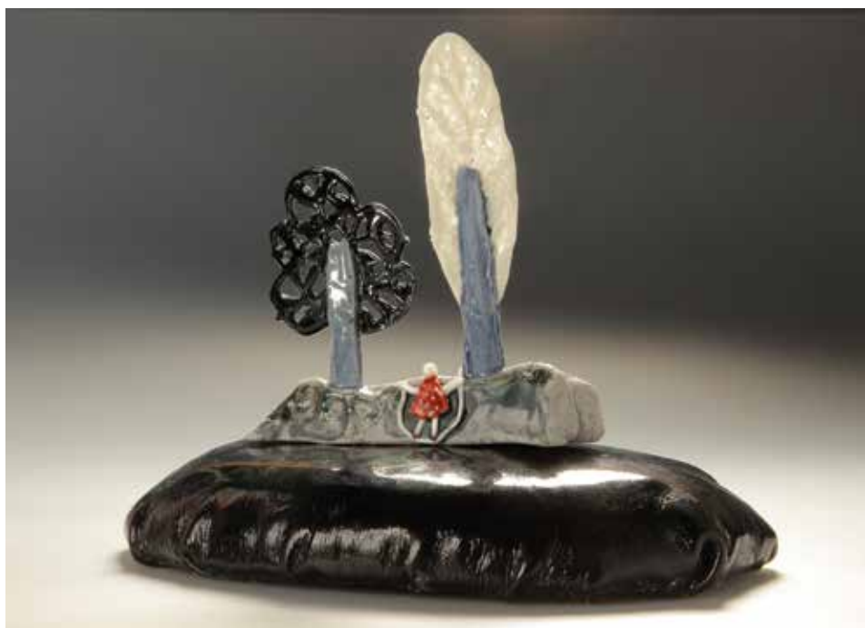
Kötél – mázas porcelán, samott; 1300 °C redukció; máz alatti festés, lakkbőr; magasság: 15 cm