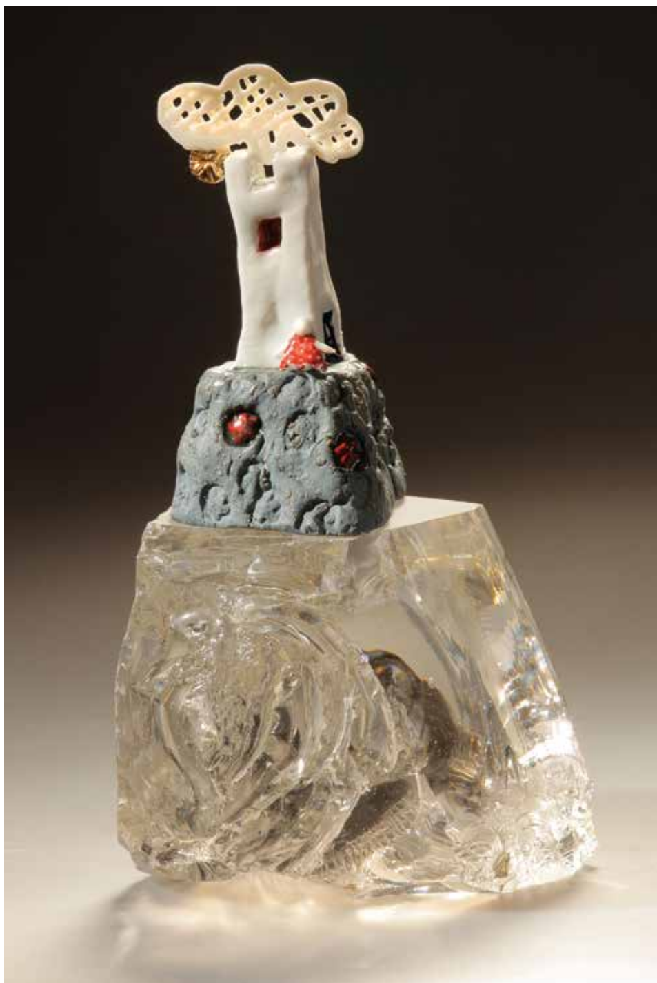
Üveghegy – mázas porcelán, samott, 1300 °C redukció, máz alatti festés, arany lüszter, üveg, magasság: 21 cm