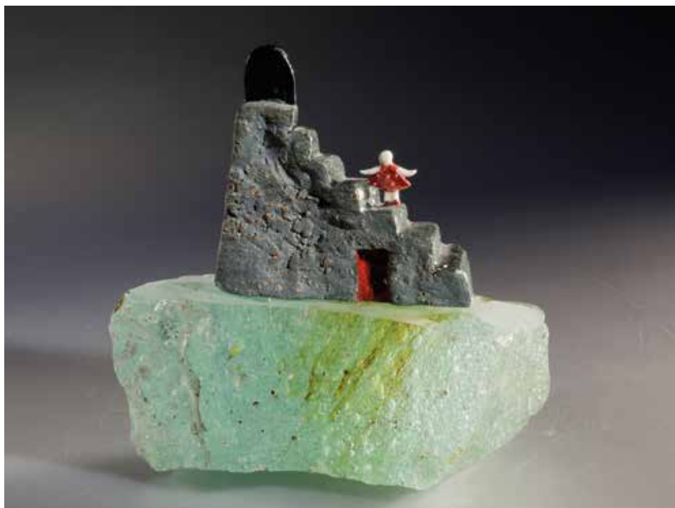
Hátsó lépcsőház – mázas porcelán, samott; 1300 °C redukció; máz alatti festés, üveg; magasság: 15 cm