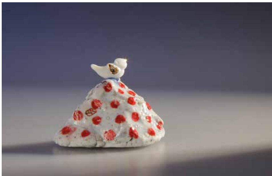
Talizmán a Hajnali Részegséghez – mázas porcelán, samott; 1300 °C redukció; máz alatti festés, arany lüszter; magasság: 4 cm