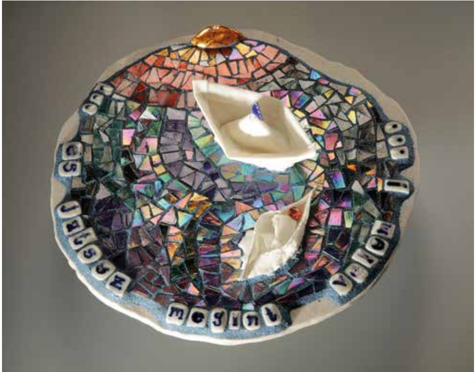
Tangó – mázas porcelán; 1300 °C redukció; máz alatti festés, arany lüszter; SICIS üvegmozaik; átmérő: 25 cm