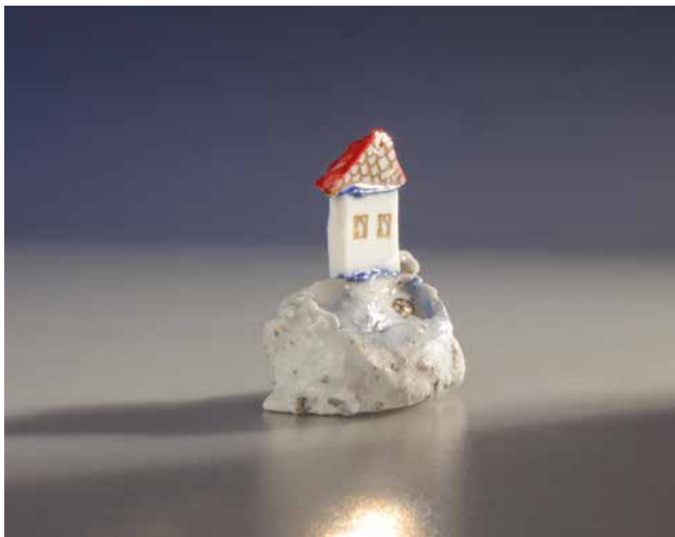
Jó lesz valamire talizmán – mázas porcelán, samott; 1300 °C redukció; máz alatti festés, arany lüszter; magasság: 3 cm