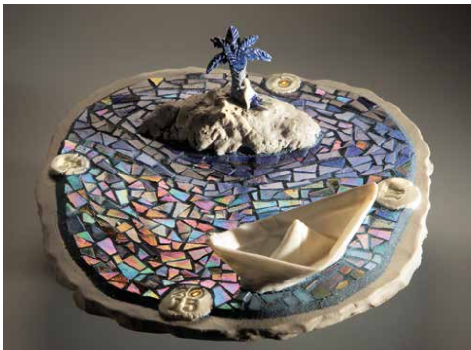
Kész – mázas porcelán, samott; 1300 °C redukció; máz alatti festés, arany lüszter; SICIS üvegmozaik; átmérő: 26 cm