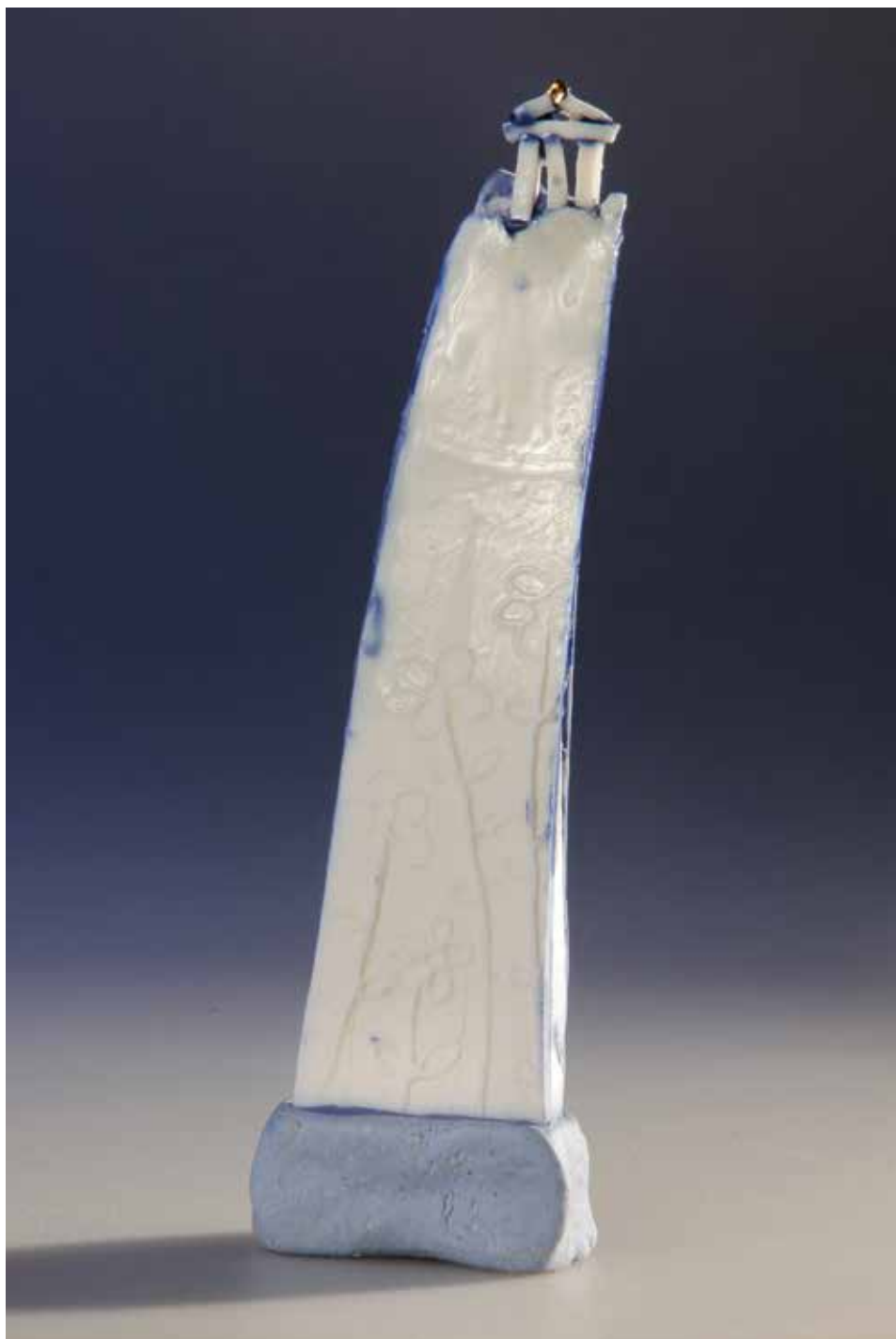
Talizmán a Reményhez – mázas porcelán; 1300 °C redukció; máz alatti festés, arany lüszter; magasság: 12 cm