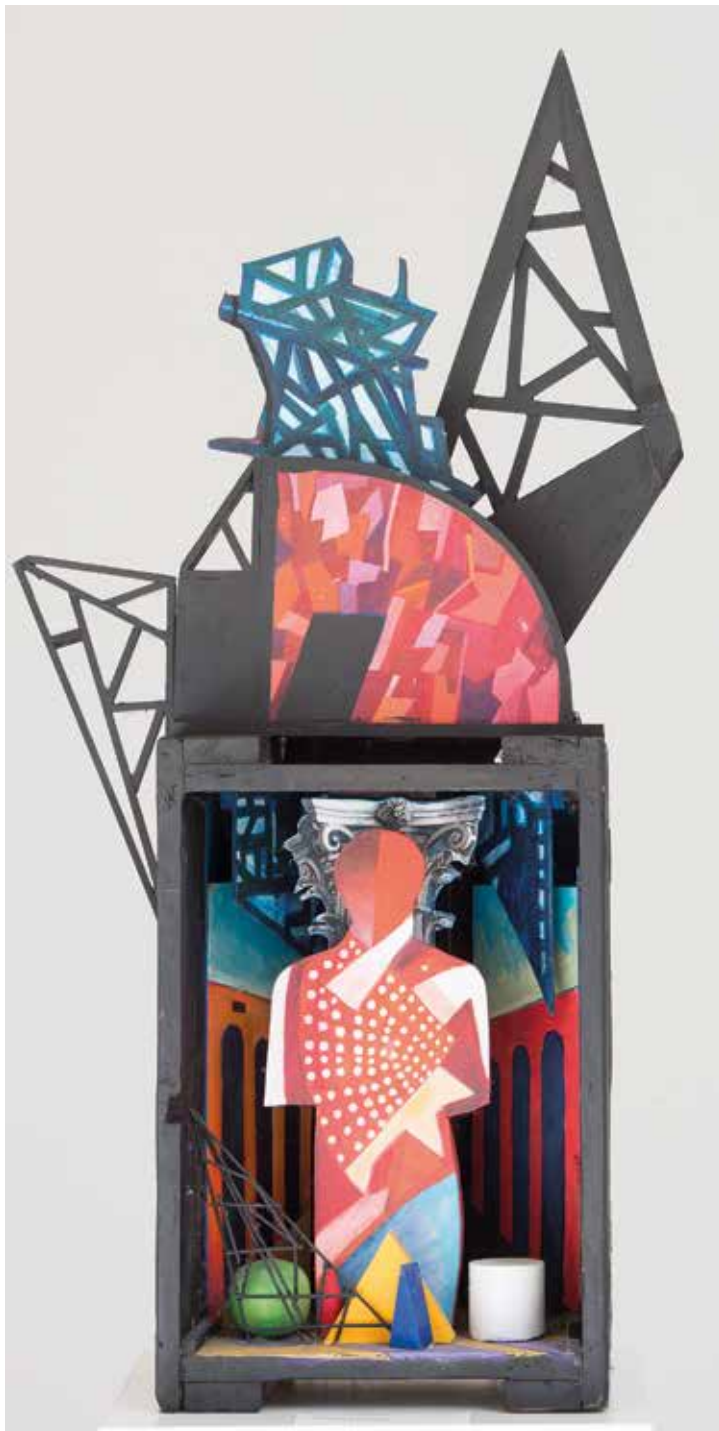
Chirico a gyárban