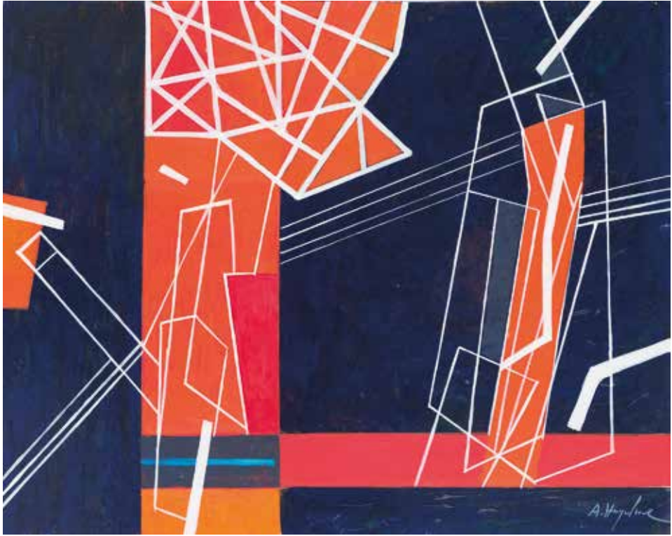
Tisztelet az építészeknek