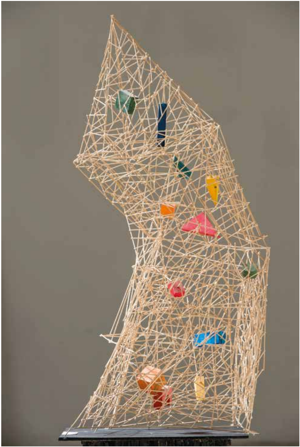
Chirico a gyárban