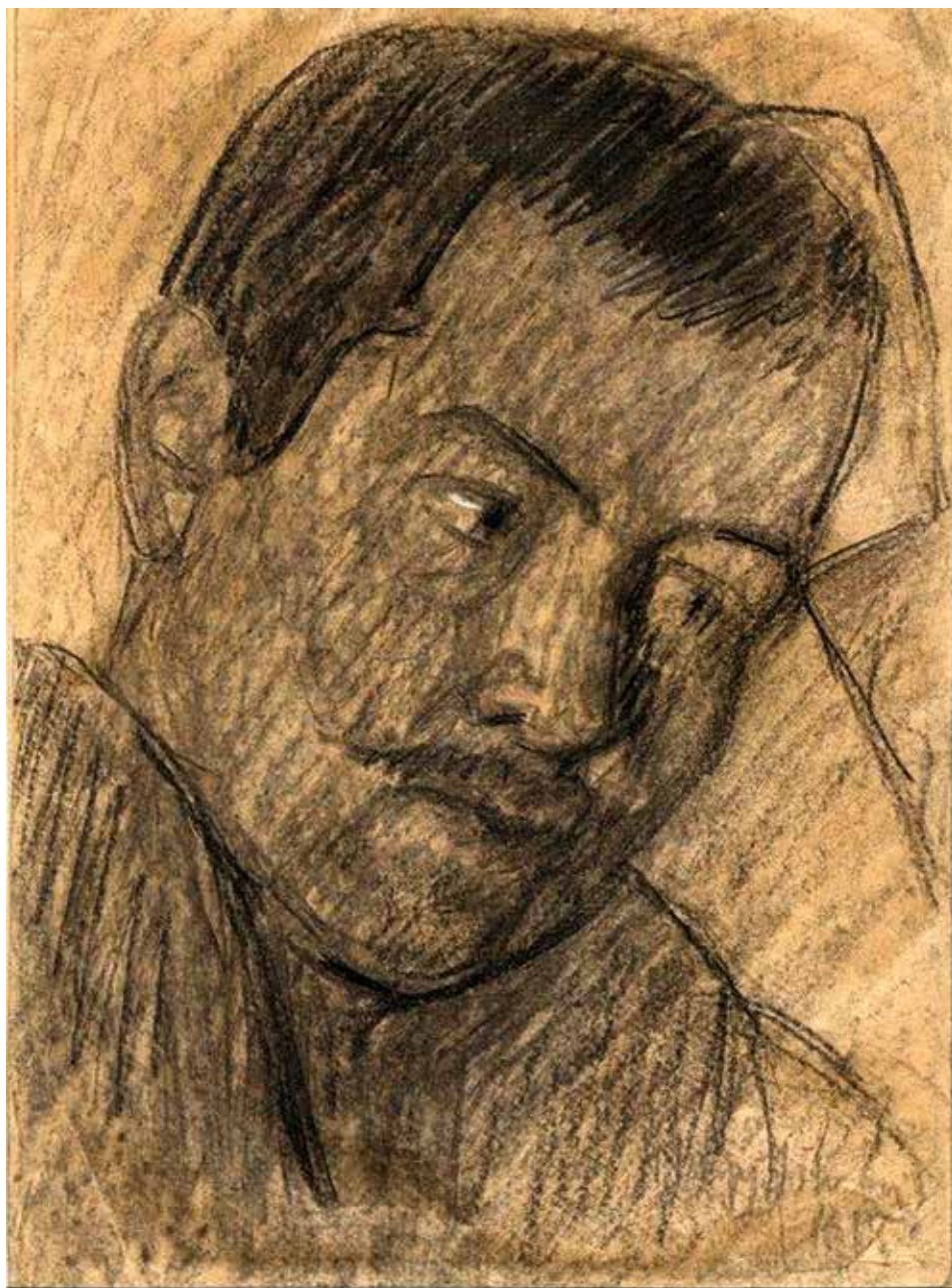
Nagy István: Férfifej, 1914