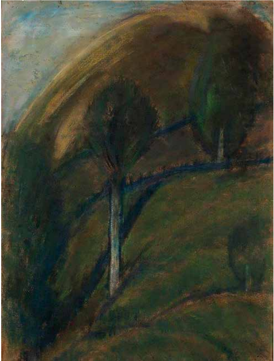
Nagy István: Csucsá, 1925