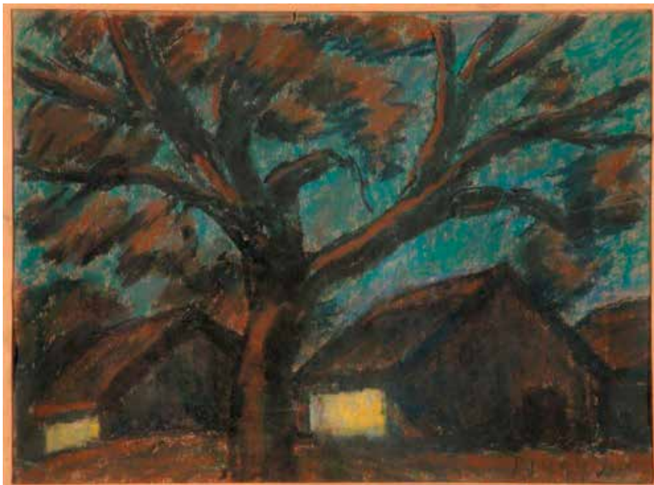
Nagy István: Házak (Keeskeméti Képtár)