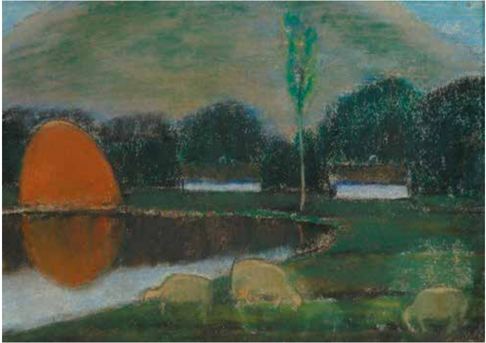
Nagy István: Tópart, 1928 k. (Türr István Múzeum, Baja)