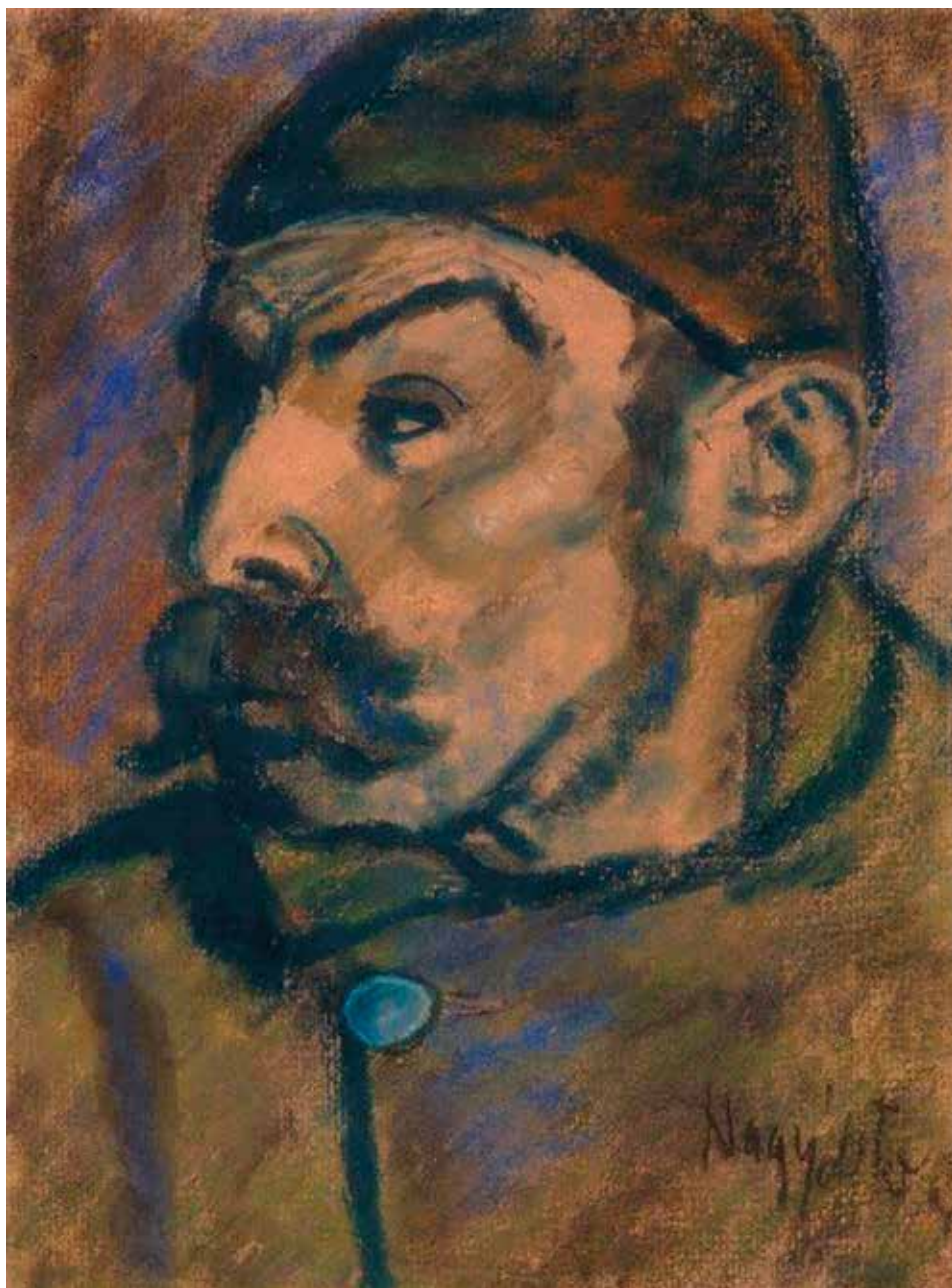
Nagy István: Kucsmás parasztféj (Kecskeméti Képtár)