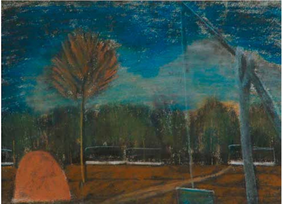
Nagy István: Félegyházi tanyák, 1923 (Türr István Múzeum, Baja)