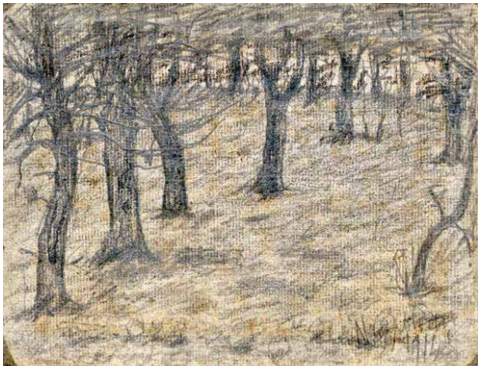
Nagy István: Erdőrészlet, 1914