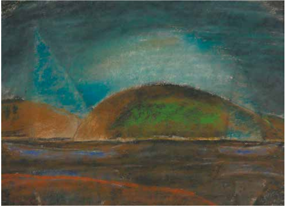
Nagy István: Balaton, 1927 (Türr István Múzeum, Baja)