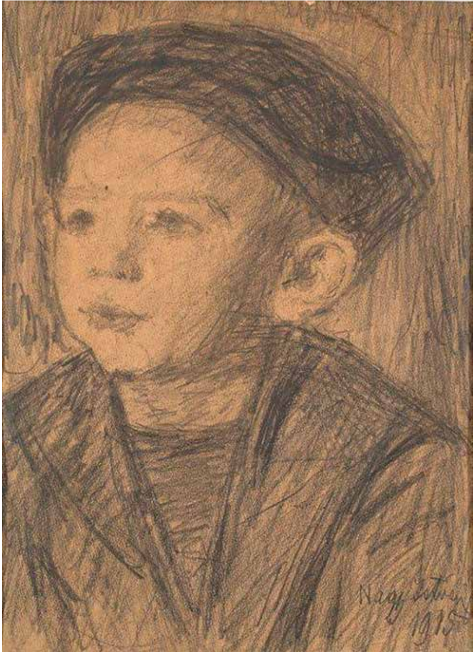
Nagy István: Fűfű, 1915