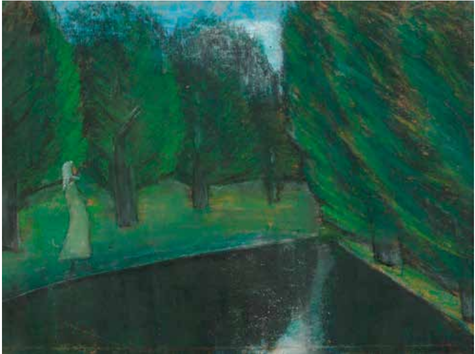
Nagy István: Hartai tóparton, 1931 (Türr István Múzeum, Baja)