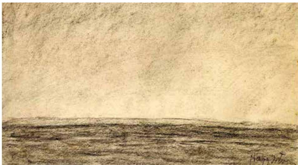
Nagy István: Balaton, 1924