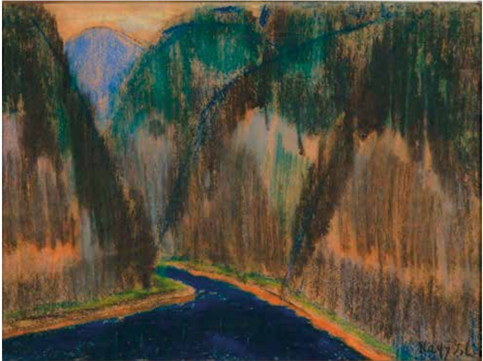
Nagy István: Gyilkos-tó, 1930 k. (Türr István Múzeum, Baja)