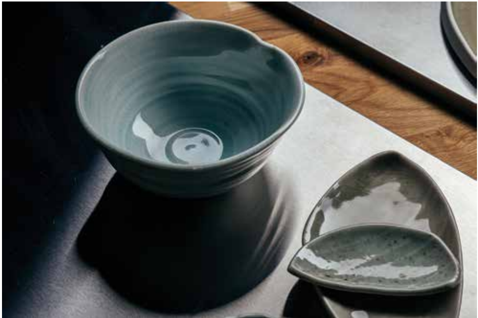
Csávós-Ruzicska Tünde munkái