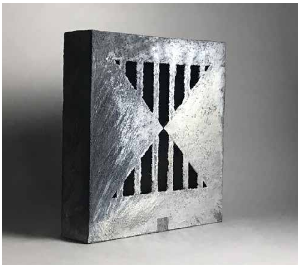
Kontor Enikő munkái