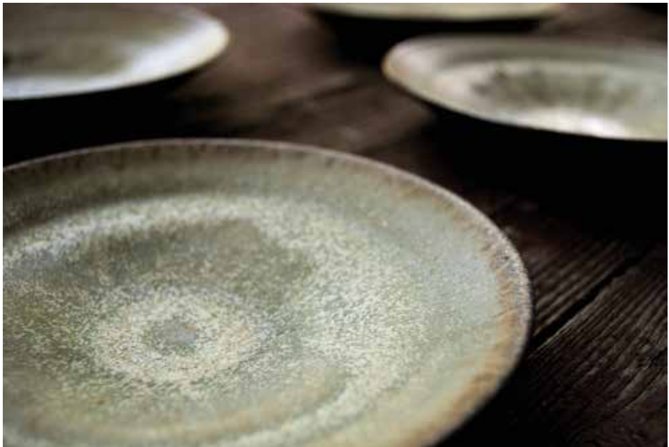
Szabó Ádám Csaba munkái