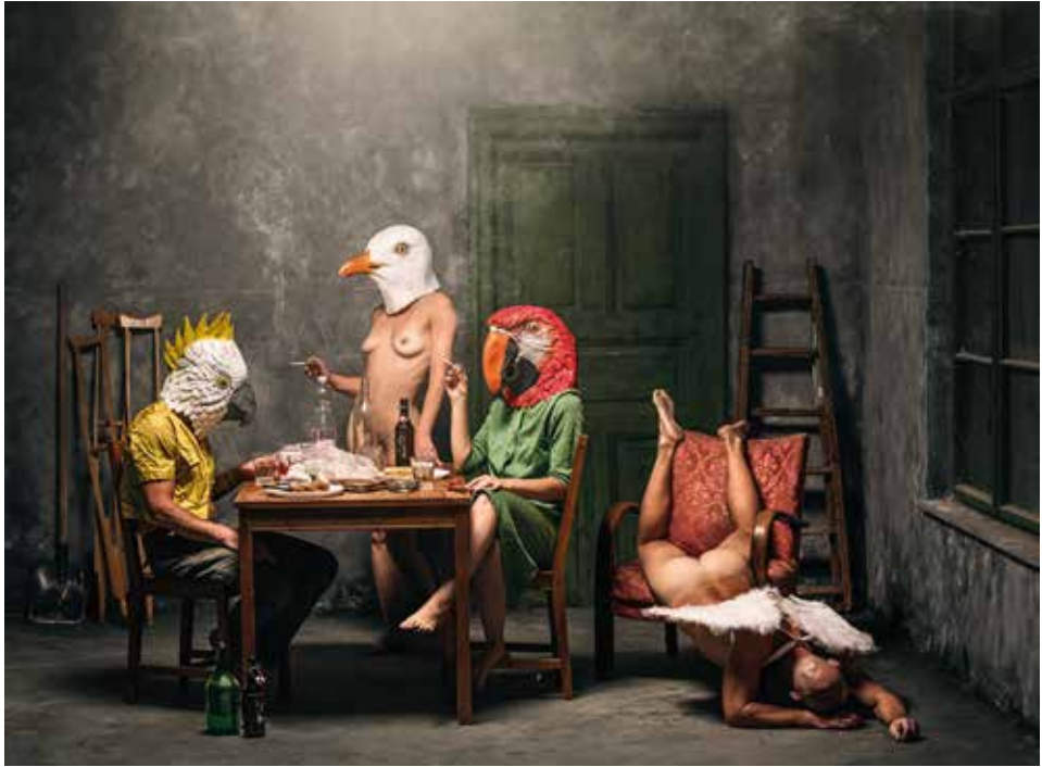
Ikarosz bukása, fölszállás előtt