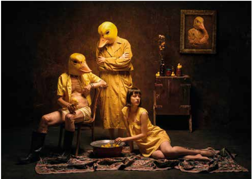
Kis kacska fürdik