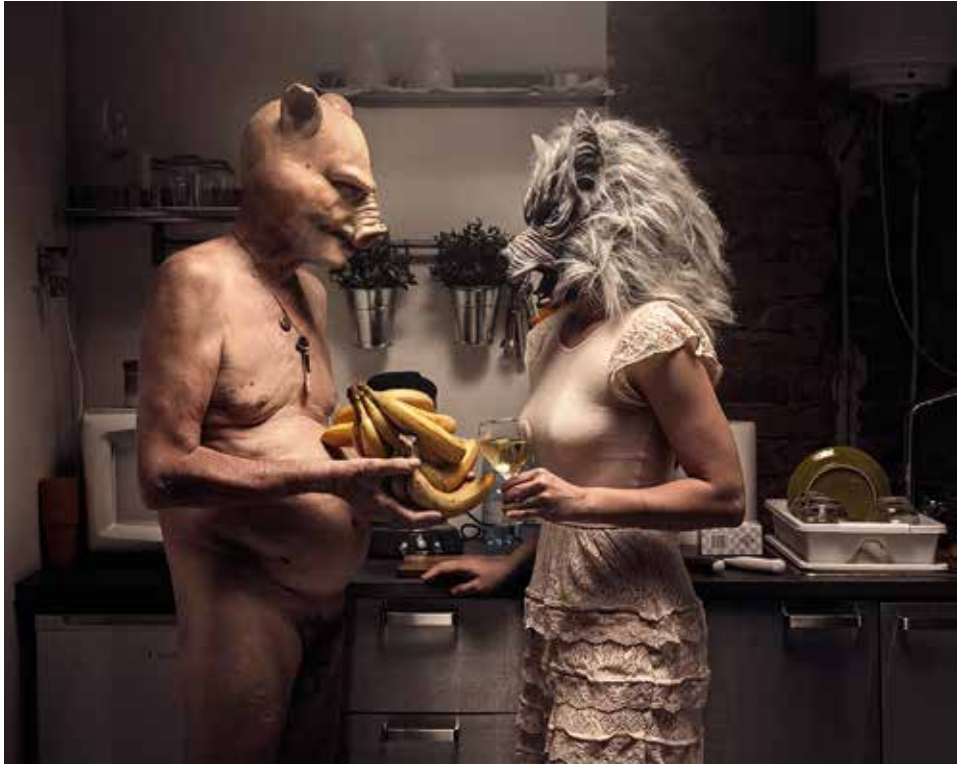
A kismalac és a farkas