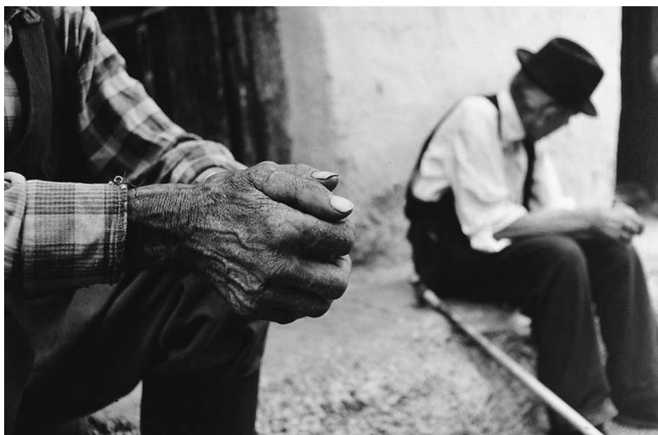
Cím nélkül (1974)