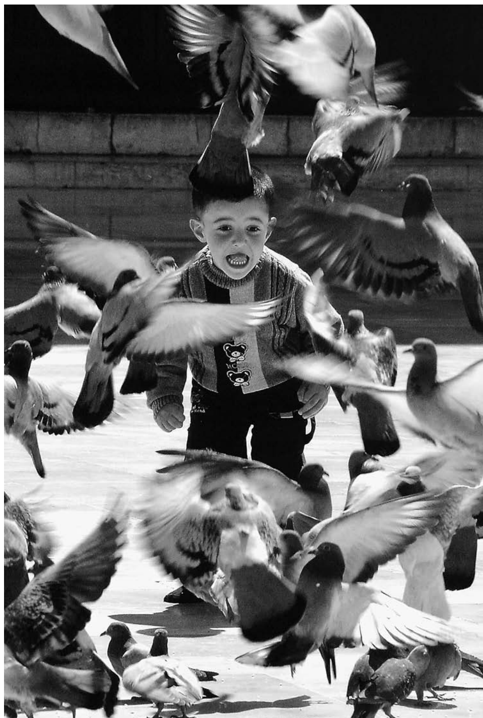
Damaszkusz béke (2004)