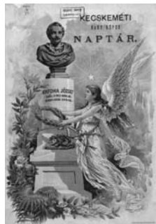
A kecskeméti Nagy Képes Naptár, 1893, cimlap Dunaiszky szobrával