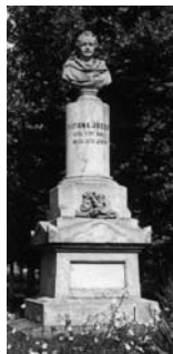
Dunaiszky-szobor, 1970-es évek