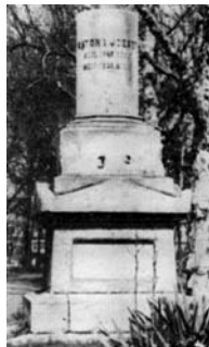
Dunaiszky-szobor nélküli posztamens