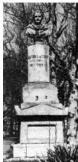
Dunaiszky-szobor, 1970-es évek vége