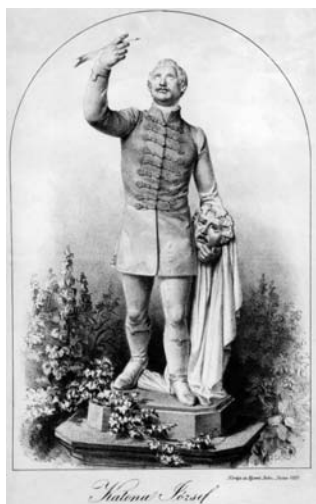
Czélkuti-Züllich Rudolf: Katona József, 1857 (Rohn litográfia, 1857)

Tanuljátok meg, mi a költő, És bánjatok szépen vele, Tanuljátok meg, hogy a költő Az istenség szent levele.