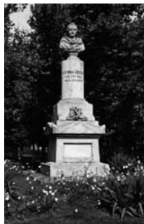
Dunaiszky László: Katona József, 1861