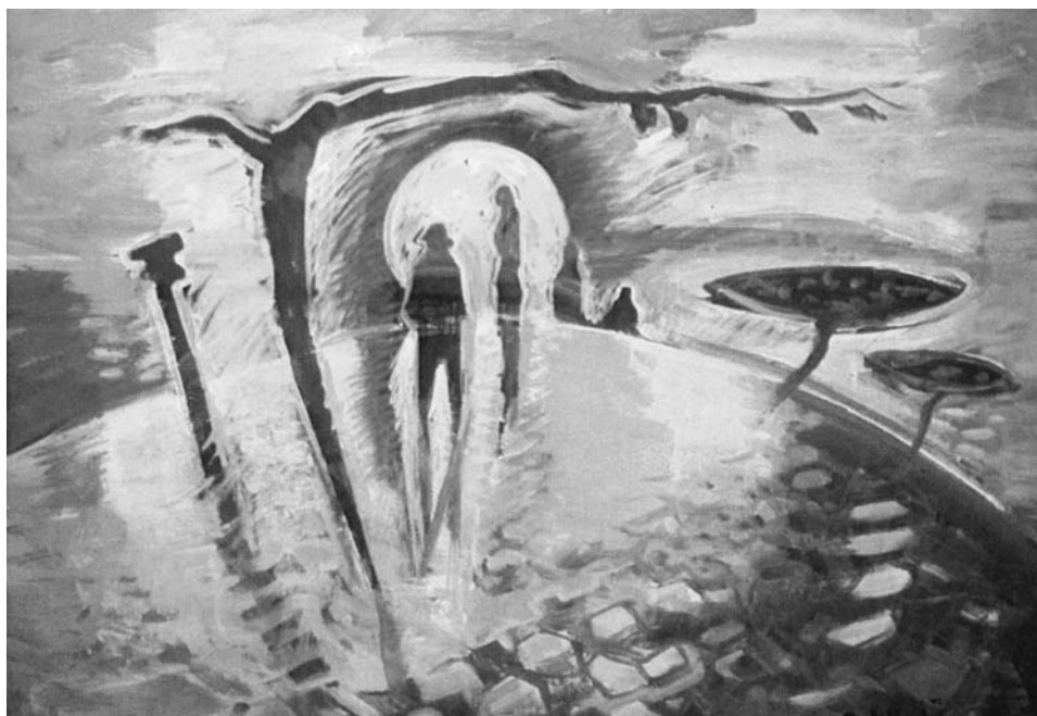
A fény útja