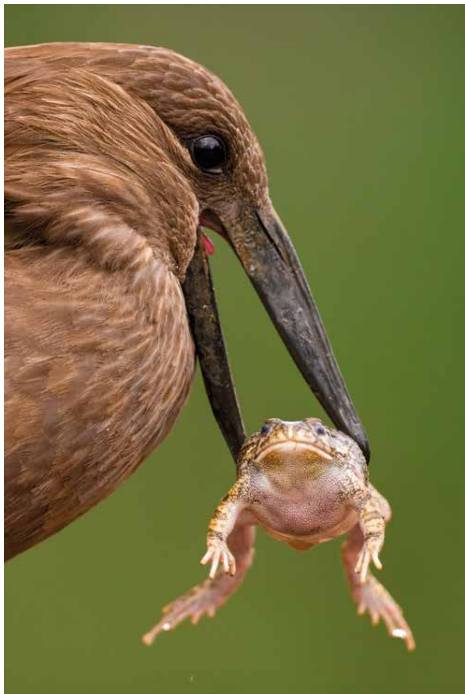
Túl nagy falat – 2014. március