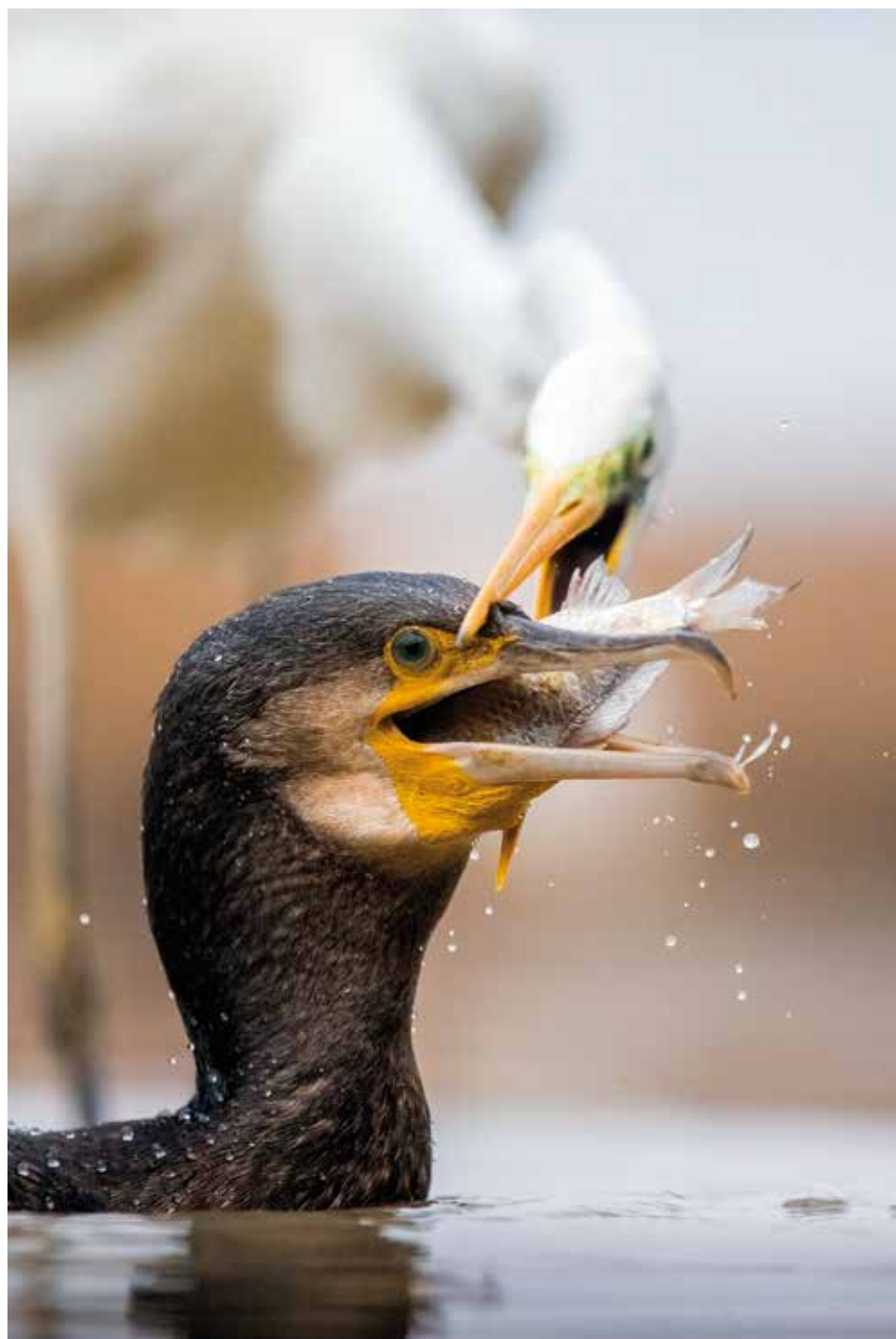
Haltokvāj – 2014. januār