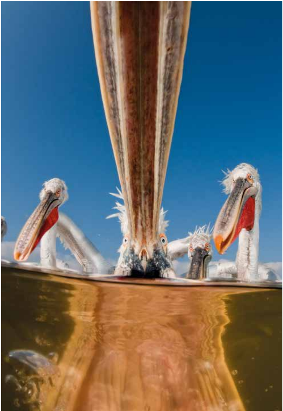
Halperspektíva – 2011. febrúar