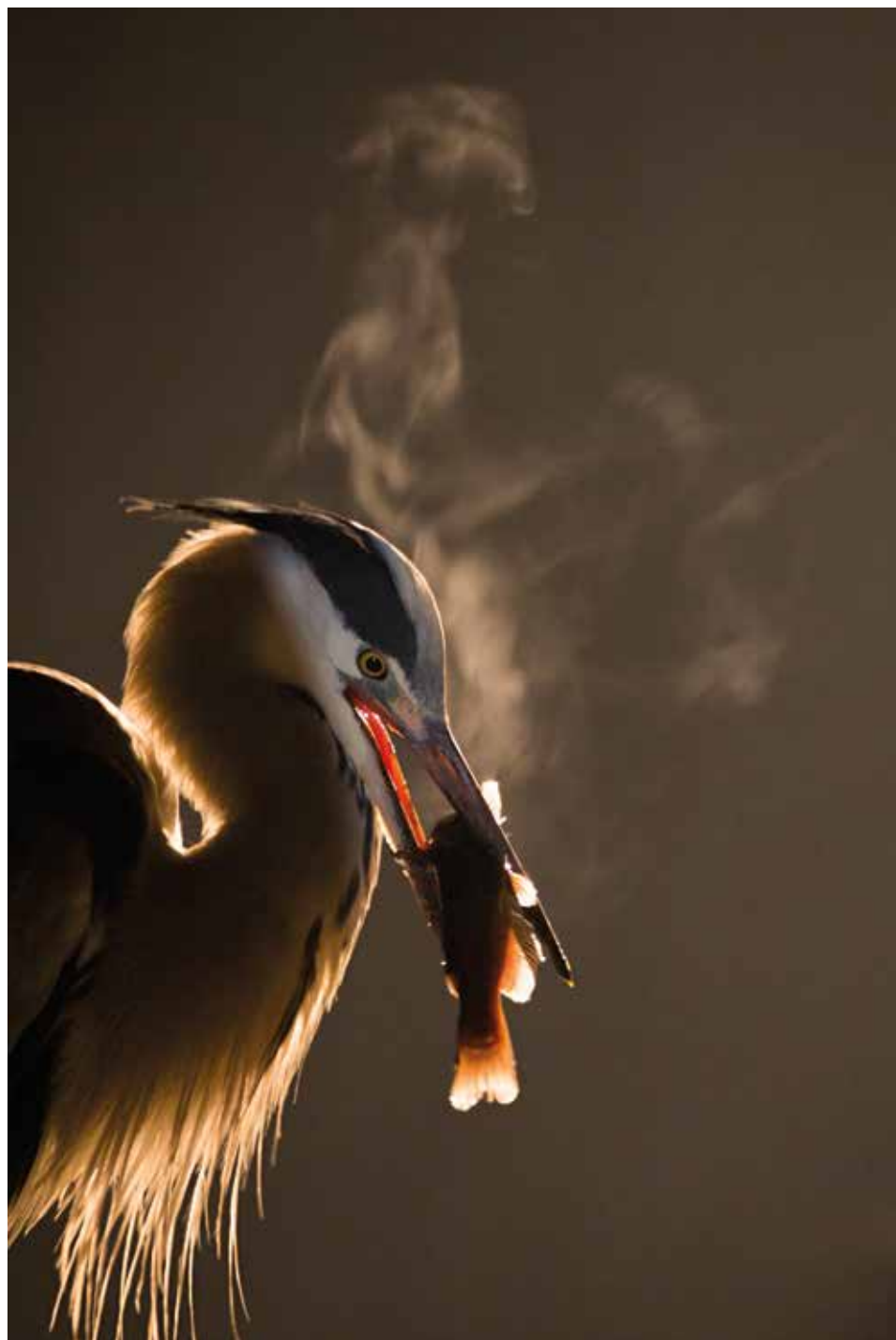
Hidegvacsora – 2015. január