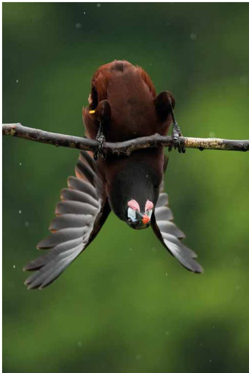
Felfordulás – 2010. január