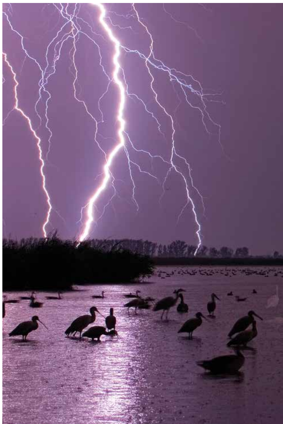
Viharmadarak – 2006. július