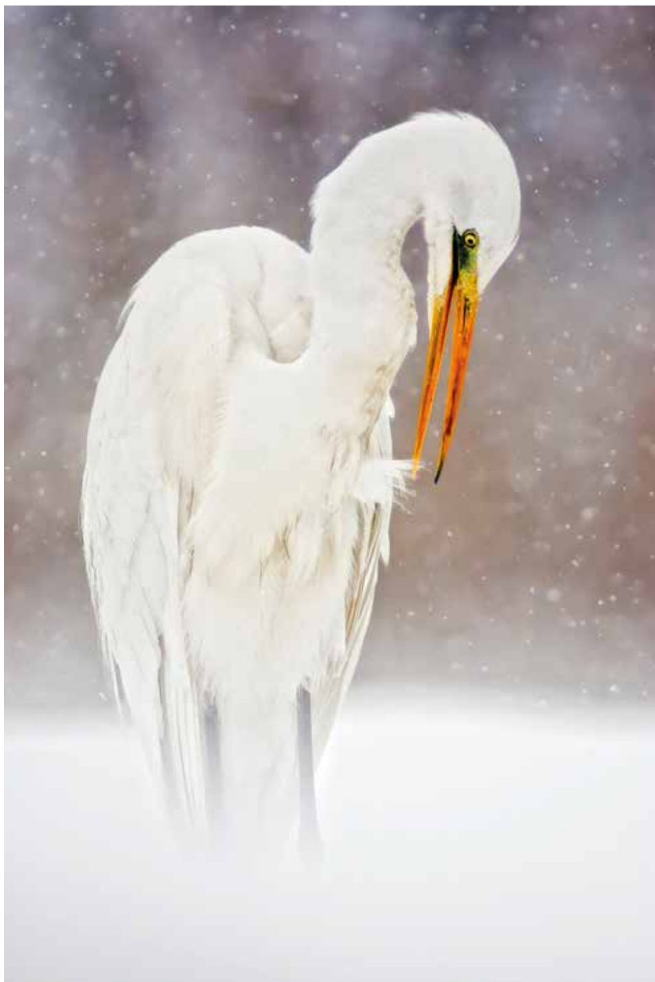
Fehérben – 2005. március