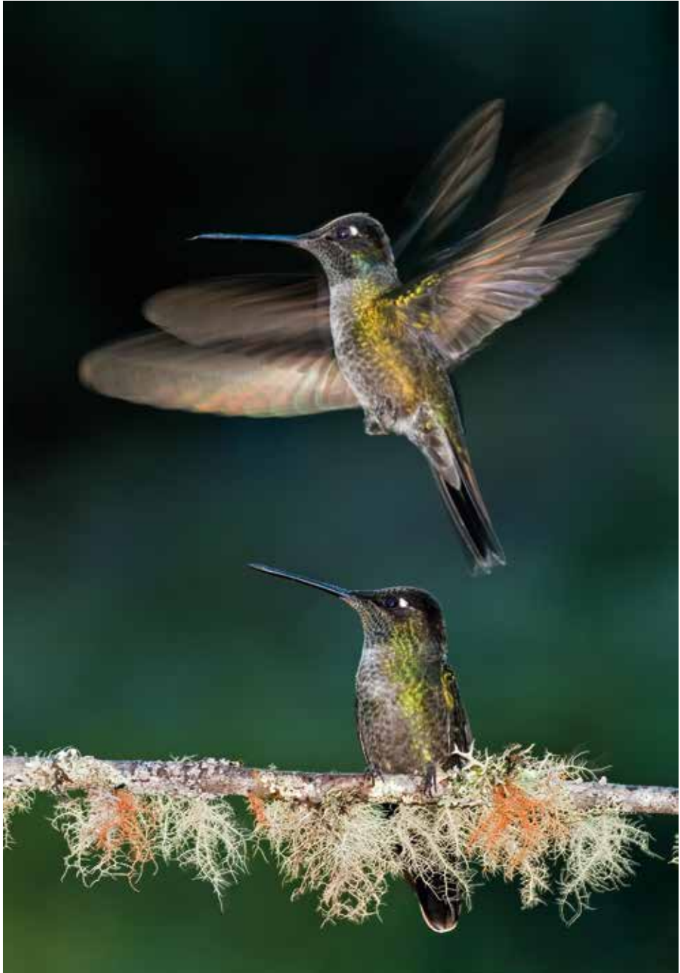
Vibrálás – 2011. január