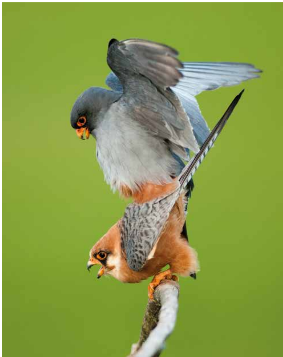
Szerlemcsata – 2008. április