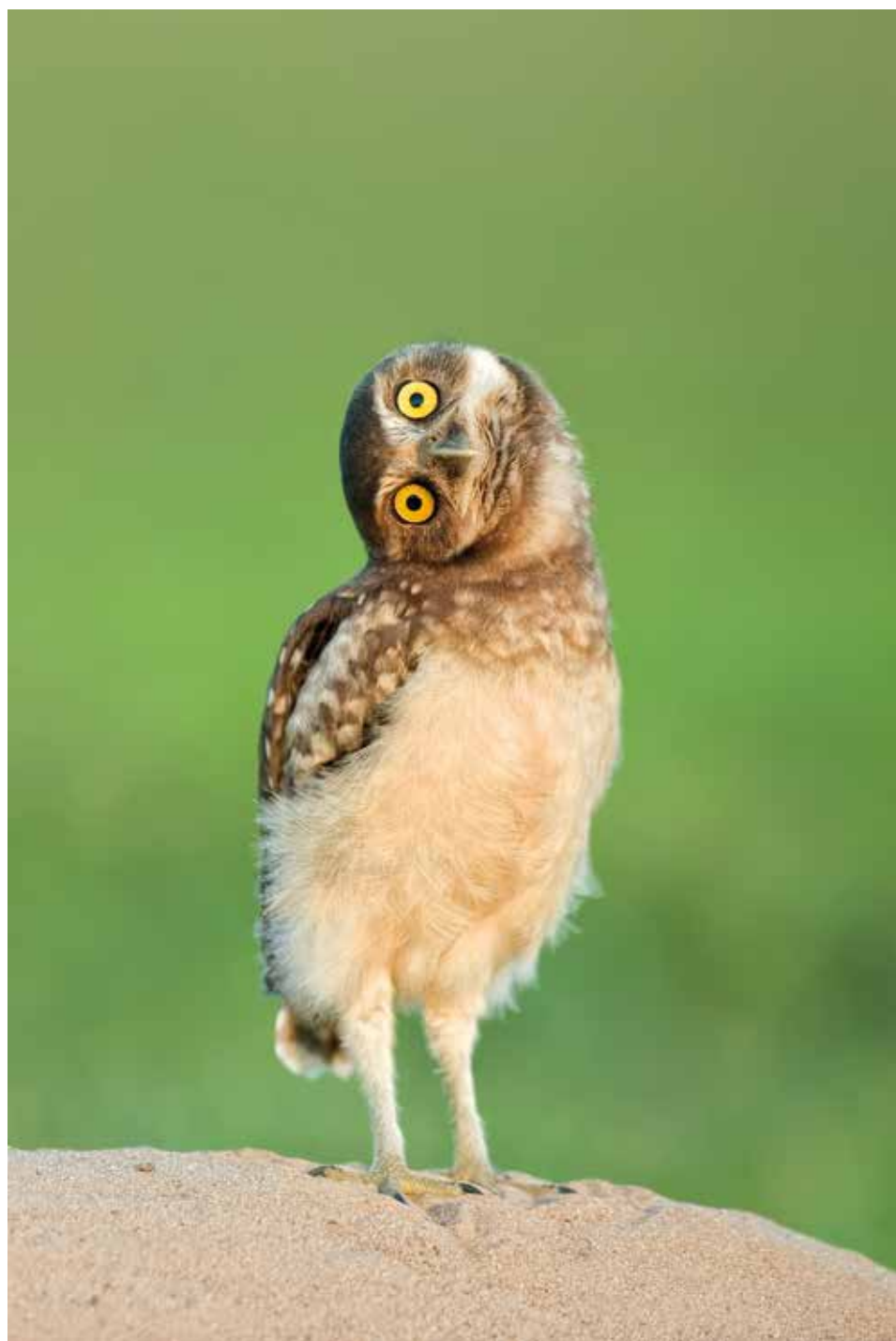
Én? – 2009. november