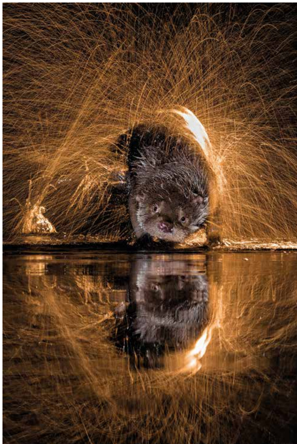
Tűzijáték – 2014. október