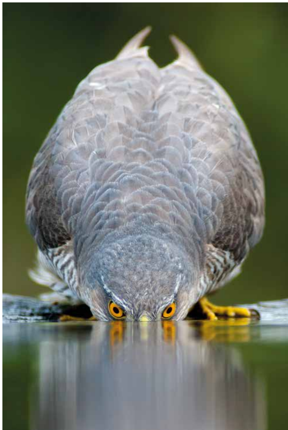
Az itatónál – 2005. április