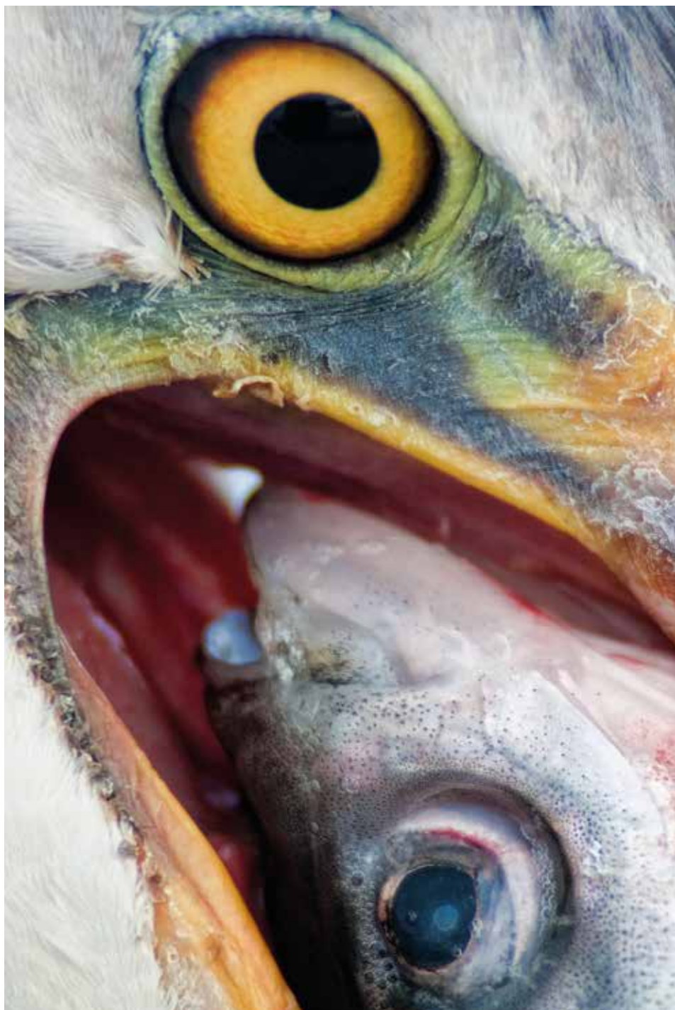
Utolsó pillantás – 2005. február