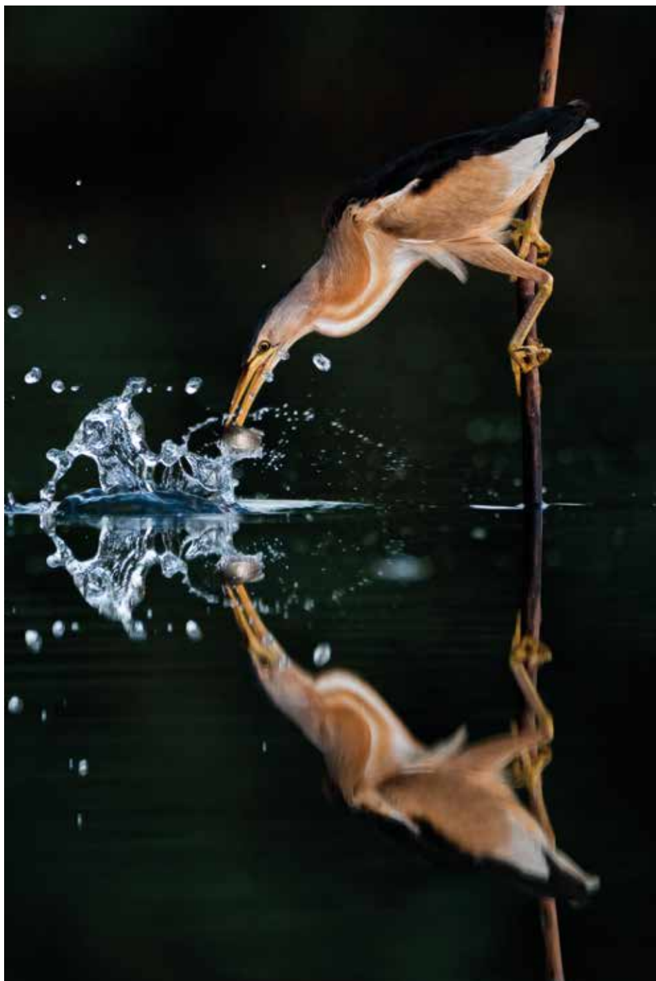
Becsapás – 2009. június